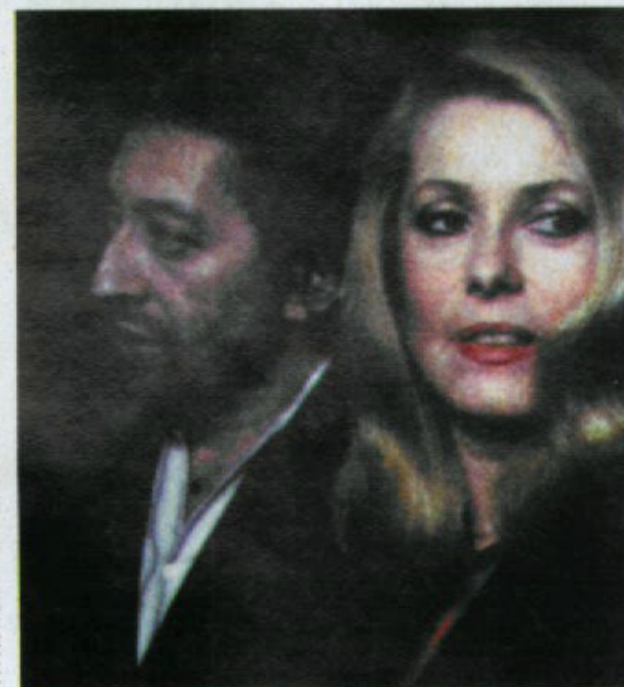
'Reporters', de Raymond Depardon.

El festival també s'aproparà a la cinematografia mexicana des d'una perspectiva històrica a través del cicle Miradas Compartides , i reivindicarà la figura de José Maria Nunes , mort aquest 2010, al qual L'Alternativa ret un homenatge merescut. Dins les seccions oficials de llargmetratges destaca la presència de Verano de Goliat de Nicolás Pereda, guanyador de la prestigiosa secció Orizzonti de la darrera Mostra de Venècia (per davant d'autors consagrat com Hong Sang-Soo, José Luis Guerín o Sion Sono), el darrer film de Harun Farocki, Zum Vergleich (2009), i l'únic llargmetratge espanyol a competició, l'experimental Los Materiales (2009) del col·lectiu Los Hijos, una proposta molt peculiar que ja va conquerir el premi Jean Vigo al festival Punto de Vista. Per acabar, cal no oblidar la sempre interessant (i gratuïta) programació de Pantalla Hall, al CCCB, de la qual destaquem els programes de curtmetratges Paradisos singulars , Poètica de les dimensions , Viatges (im)mòbils i Llegats conflictius . -X.S.